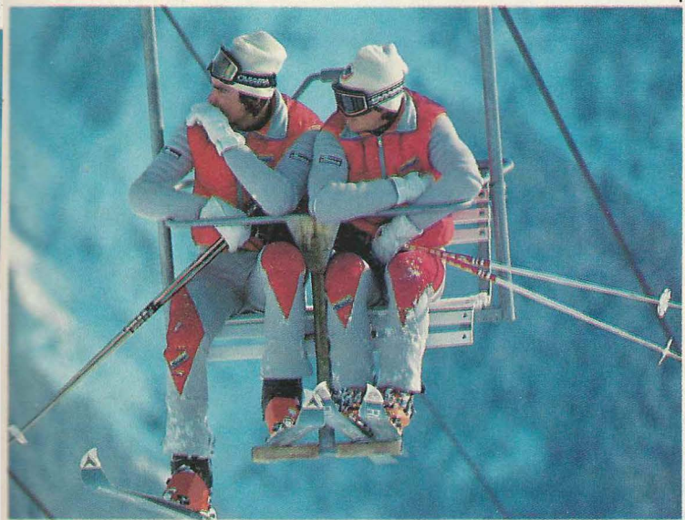
Närmast ovan: Två elitåkare på väg upp till starten. Annat var det förr. (Överst: Schweiz' tjejlager tar "fotliften" upp någon gång på 30-talet.

Den japanska regeringen ville göra skidsporten populär, fostra goda åkare och utbildade skidlärare. Schneider återvände hem firad med ordnar och ärebetygelser. Den första alpina skidskolan med St Anton som födelseort och Hannes Schneider som skapare fick snart efterföljare i hela alpvärlden och dess grannländer som Tysk-