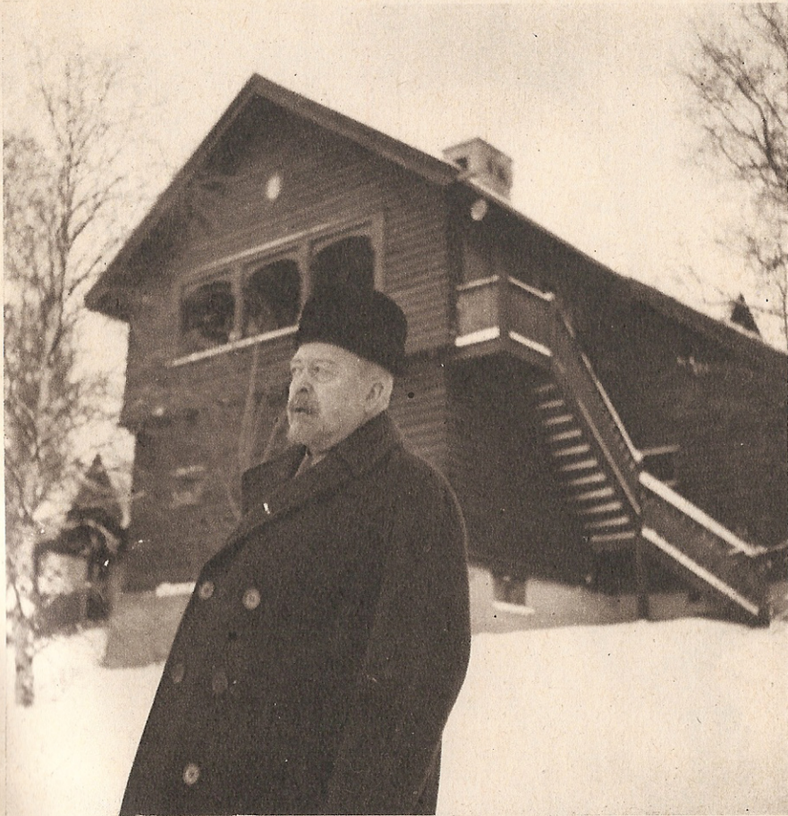
HAN HAR SEDAN DESS varit en vass kritiker men fått åtskilligt igen av sina belackare. 1910 slog P. B. definitivt rot i sitt inspirerande Jämtland, då han köpte tomt till »Sommarhagen», lika pampigt och originellt vintertid.