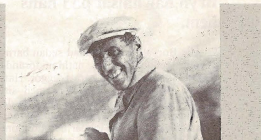
Hannes Schneider, skaparen av Arlberg-tekniken och den världsberömda skidskolan i St Anton am Arlberg.