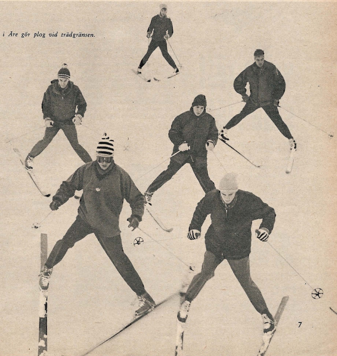
Utförsåkarna i Are gör plog vid trädgränsen.