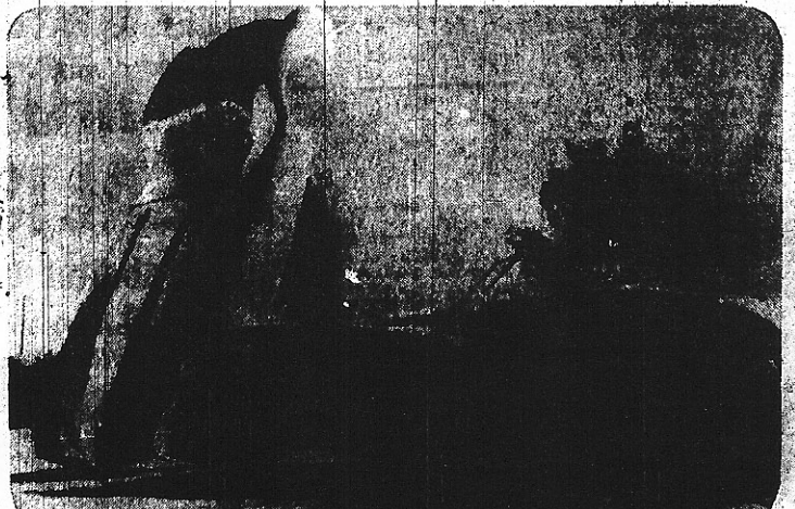
Karosseriet sjuts i ett stycke, väger knappt 84 kg och är i sådant sticck hårt genomskadigt. Tydligt man håller upp karosseriet till vänster, och de syns som svarta kluggor.