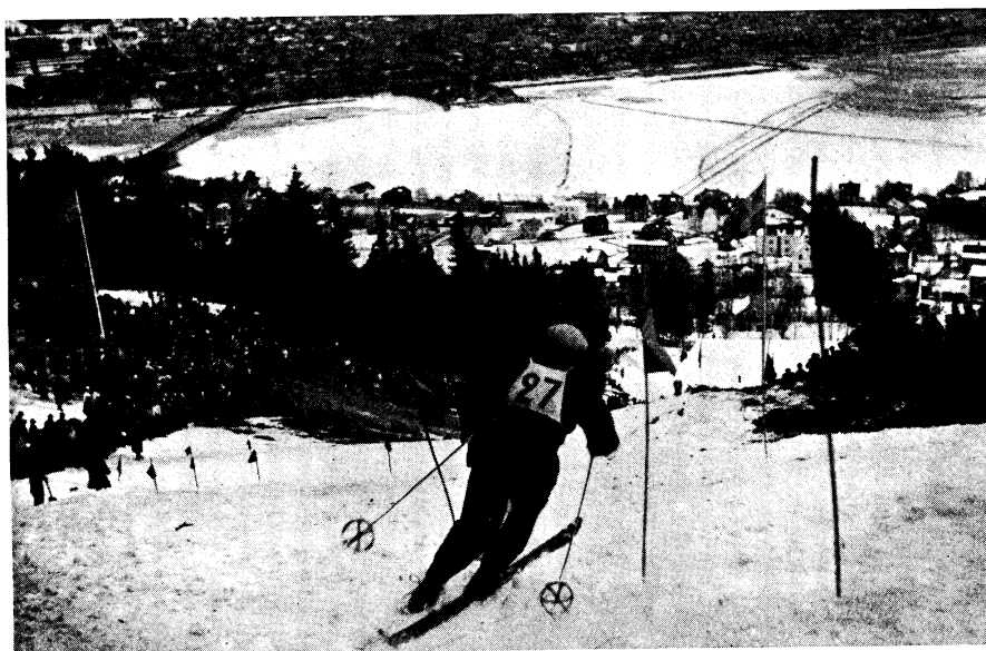
Slalombanan vid S. M. i slalom i Östersund 1937.