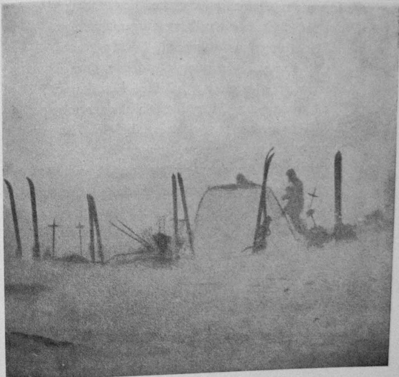
Igloo i storm! Första bygget i 24 meters »blåst». Klipp ur Nordenskiölds film som blev 3—4 meter lång.